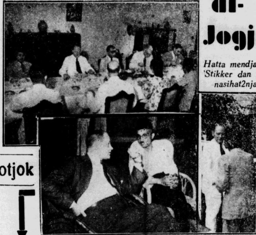
Hatta mendjamu 'Stikker dan penasihat2nja.

Margunsarkoro, pemimpin PNI lagi mendengarkan pendapa2 Mr. Stikker tentang Indonesia-Bung Mangun — sebagai biasa — berpetji, bersarang dan bersandjal.